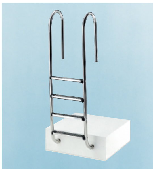
Лестница модель 350