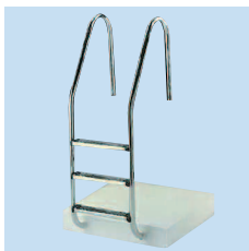
Лестница модель 650