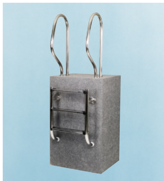
Лестница модель 450