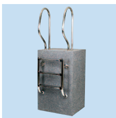
Лестница модель 450 – разделенная