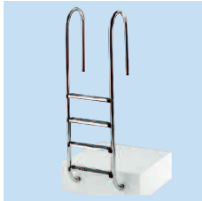
Лестница модель 350