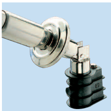
Опрокидывающий механизм с встраиваемой гильзой (пример монтажа)